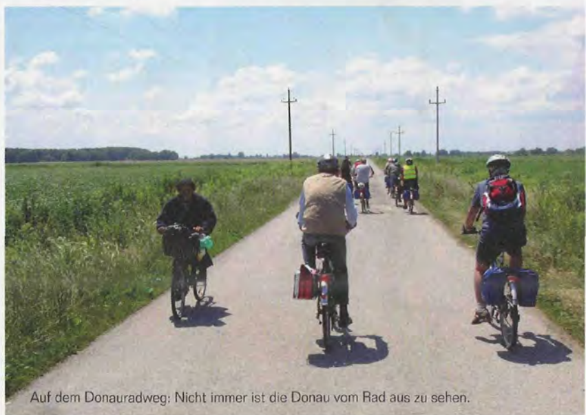
Auf dem Donauradweg: Nicht immer ist die Donau vom Rad aus zu sehen.