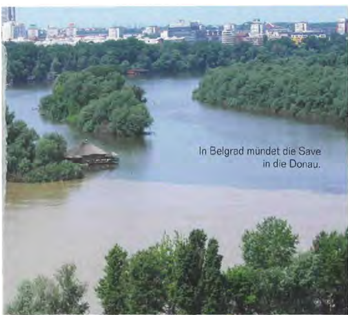
In Belgrad mündet die Save in die Donau.

kammer 4 des Landes. Kroatien hat mit 137 Kilometern nur einen relativ kleinen Anteil am Donaustrom. So kann man auf dem Weg nach Serbien einen Abstecher nach Osijek machen, rund 20 Kilometer von der Mündung der Drau in die Donau gelegen. Osijek war im Kroatien-Krieg zwischen 1991 und 1995 unter starkem Beschuss. Viele Denkmäler erinnern an den Krieg: Am Hauptplatz stehen Kanonenrohre, sie sind mit Papier gestopft. In einem Kirchenhof steht ein Kunstwerk aus Waffen, das Christus am Kreuz darstellt. An jener Kreuzung, auf der ein Auto von einem Panzer überrollt wurde, steht jetzt ein Kunstwerk: ein Auto, das einen Panzer überrollt.