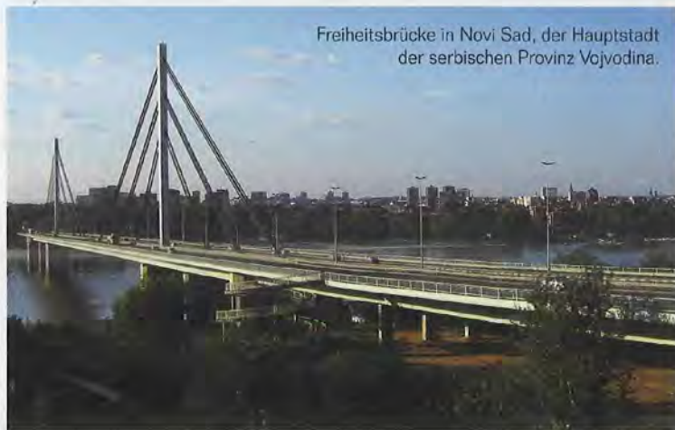
Freiheitsbrücke in Novi Sad, der Hauptstadt der serbischen Provinz Vojvodina.

Nachdem man bei Udvar an der Grenze zuerst den ungarischen, dann den kroatischen Zöllnern seinen Pass gezeigt hat, geht es durch Slawonien, die „Korn-