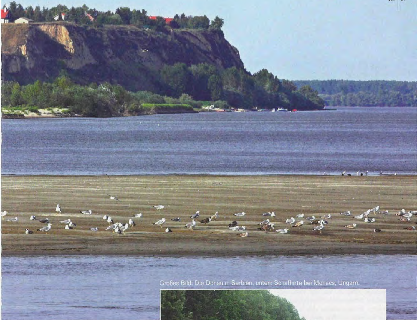
Großes Bild: Die Donau in Serbien, unten: Schafhirte bei Mohacs, Ungarn.

aber noch ein Geheimtipp – besser gesagt: Abenteuer. Fährt man doch oft auf Straßen, die auch von (mal mehr, mal weniger) Autos frequentiert werden, deren Lenker über Radfahrer auf der Strecke (noch?) einigermaßen überrascht sind.